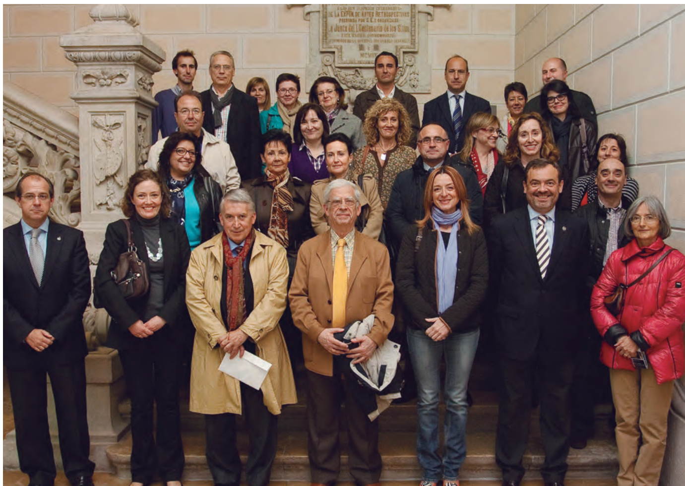
Fotografía del grupo al finalizar la visita

El resurgimiento del capitalismo mercantil y la Banca en el renacimiento, así como la explicación del comercio como instrumento de paz y de guerra, la explosión de la economía y aparición del comercio de lujo